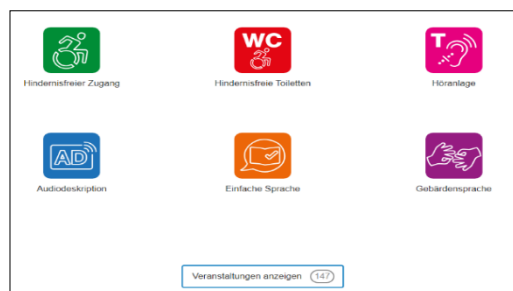
Abbildung 2: Piktogramme; hier Auszug aus ZH

Zukunft Inklusion ist viersprachig: Deutsch, Französisch, Italienisch und Romanisch. Die Kantone